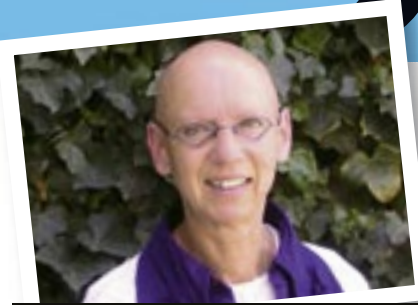
ELS ROSSOU WERD PLOTSELING KAAL

Met die pruik op was ik mezelf niet, zonder voel ik me veel vrijer